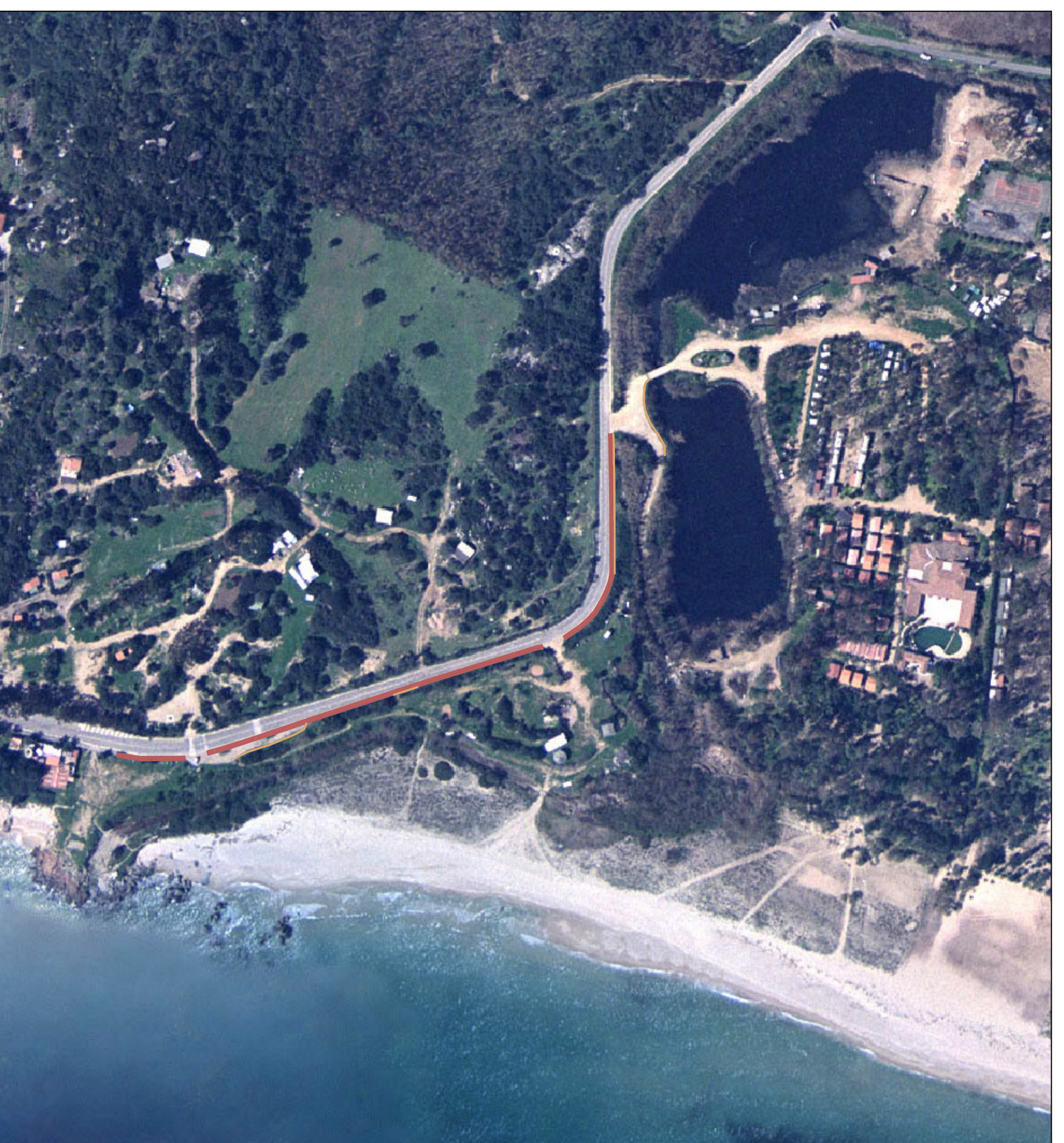
Simulazione intervento su foto aerea. Scala 1:2000