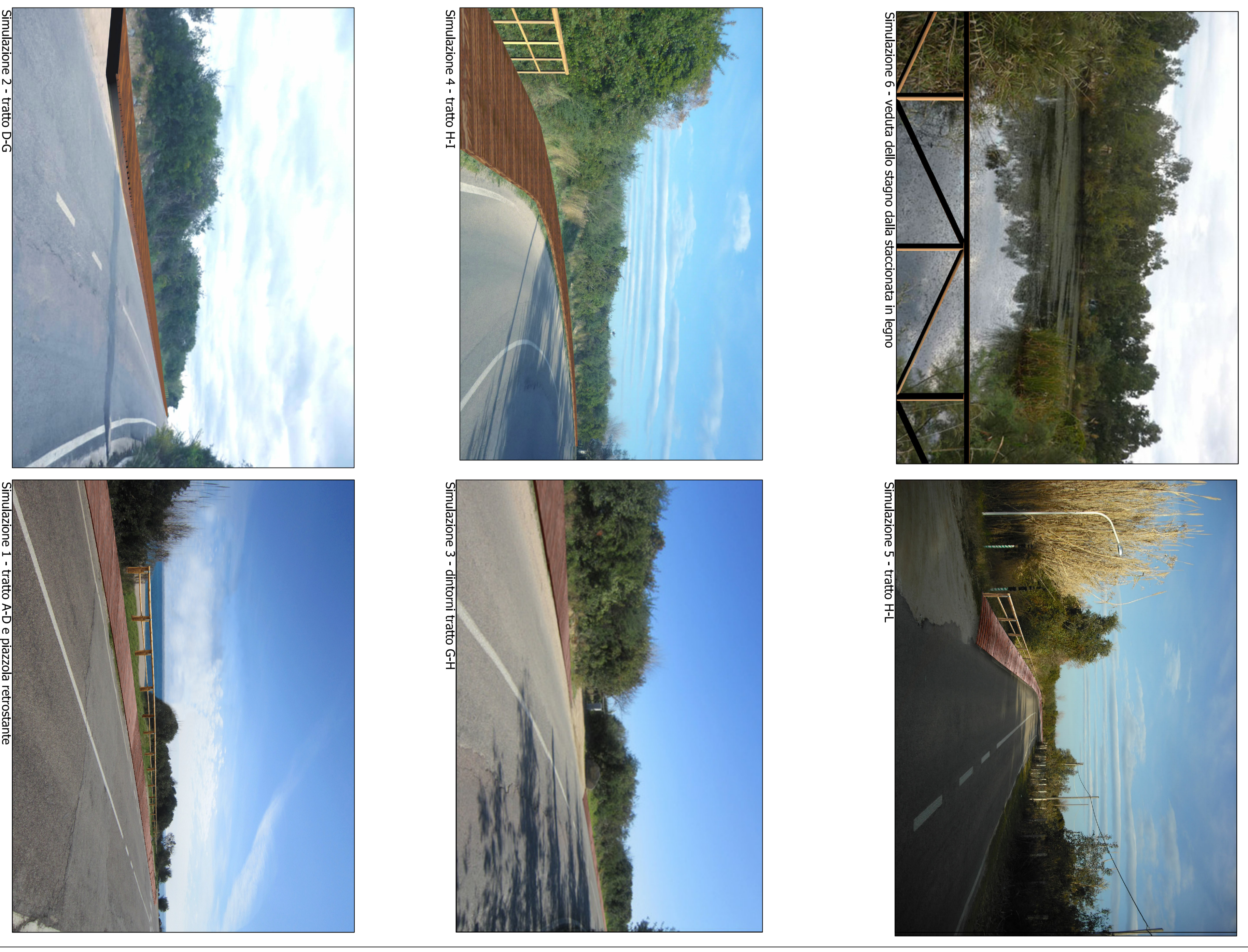
Simulazione 6 - veduta dello stagno dalle staccionate in legno